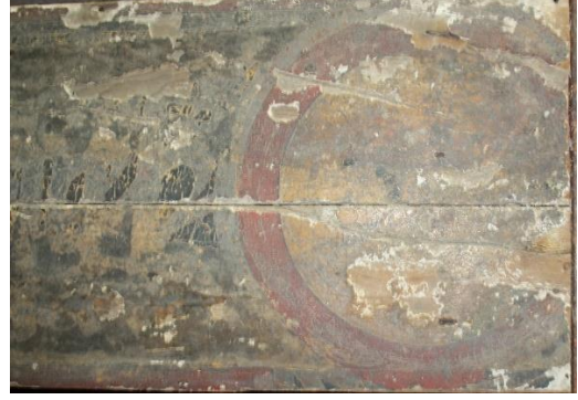
Şekil 6. Mevlana Celeleddin-i Rûmî'nin mermer sandukası üzerinde yer alan 4 no'lu müzeyyen ahşap kapak.