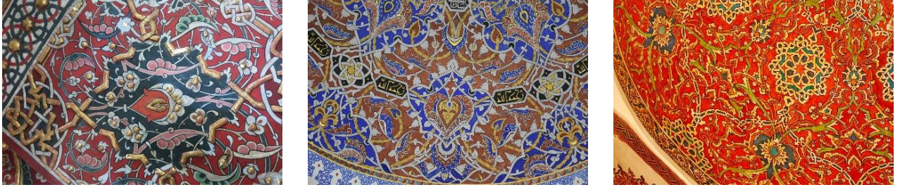
Şekil 1 Mevlana Celâleddin-i Rûmî Türbesi, Bursa Cem Sultan Türbesi, Hacıbektaş Veli Türbesi Kalemîşi Örnekleri

Türbe tezyînâtının bu şekilde kompoze edilmesinin yanında çalışmamıza esas konu olan, Hz. Mevlana Celâleddin Rûmî'nin sandukası üzerine sonradan yerleştirilmiş beş ahşap parçadan müzeyyen dört adet ahşap parçanın tezyînât bağlamında değerlendirilmesidir. Asıl kullanım yerlerinin neresi olduğu konusu müphem olmakla birlikte, parçaların bu birime nereden intikal ettiği de bilinmemektedir. Dolayısıyla parçalar hakkında hüküm vermek oldukça zordur. Ancak bu ahşap parçaların yüzeyleri türbe dâhilinde gördüğümüz tezyînî örnekleri bünyesinde barındırmaktadır. Öyle ki, türbe duvar ve filayak yüzeylerinde görmüş olduğumuz nakışların benzer örnekleri renk ve üslup bakımından ahşap parçaların yüzeylerini tezyîn etmektedir. Kompozisyonda yer alan rûmî motifleri incelediğimizde motifler anatomik anlamda devrinin özellikleri aynen yansıtmaktadır. Buradan edindiğimiz intibalardan bu ahşap parçaların dergâh dâhilinde bulunduğu ancak geçmiş dönemlerde gerçekleştirilen bir takım tamirat ve tadilat esnasında hurdaya çıkarıldığı ve bu süreçte ihtiyaca binaen burada kullanılmış olmasıdır. Her bir parçanın tezyînâtı devrin üslubunu yansıtmış olsa da genelde bir bütünlük arz etmemektedir. Hatta parçalardan birinin üzerine ateşle temas etme neticesinde yanık izinin bulunması, bir diğer parçanın bez üzerine kalemîşi tezyînâtının uygulanmış olması parçaların farklı birimlerden tedarik edilerek kullanılmış olduğunu göstermektedir (Şekil 2).