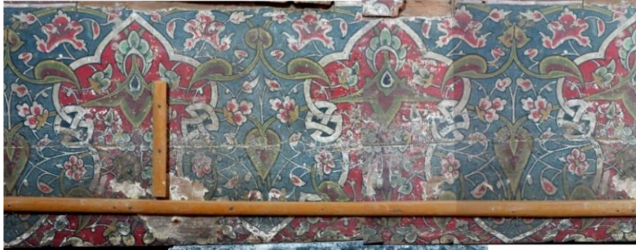
Şekil 5 Mevlana Celaleddin-i Rûmî'nin mermer sandukası üzerinde yer alan 3 no'lu müzeyyen ahşap kapak.

Ahşap parçalar içerisinde en detaylı olan bu parçanın tasarımında rûmî, hatâî ve düğüm motifleri birlikte kullanılmıştır. 2 no'lu parçanın renkleri bu parçada da görülmektedir. Zemin renkleri aynı şekilde turkuaz ve kırmızı, her iki rengin ayırımında düğümlü ve dendanlı bir ayırma kullanılmıştır. Rûmî ve hatâî motiflerinde benzerlik olsa da her iki motifin renklendirilmesinde kademeli renklendirme tekniği uygulanmıştır. Rûmî motiflerde bordo, yeşil ve oksit sarı, hatâî motiflerinde bordo, kırmızı ve beyaz renkler, düğümlerde ise siyah, beyaz renkler tercih edilmiştir. II. Bayezid Devri üslubunu birebir yansıtan bu müzeyyen ahşap parça 46 x 166 cm. ölçüsündedir (Şekil 5), (Çizim 3).