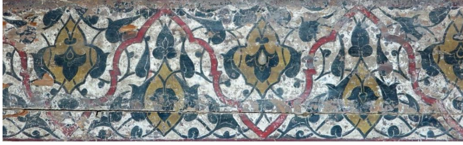
Şekil 3 Mevlana Celaleddin-i Rûmî'nin mermer sandukası üzerinde yer alan 1 no'lu müzeyyen ahşap kapak.

47 x 177 cm. ölçülerindeki bu parçanın tasarımında kullanılan renkler, beyaz, siyah, kırmızı ve oksit sarı renklerden oluşmaktadır (Şekil 3), (Çizim 1).