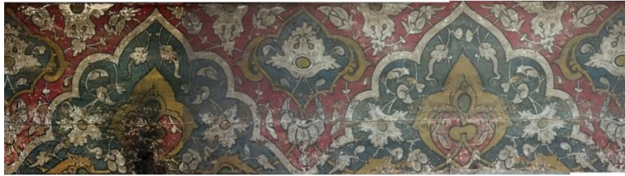
Şekil 4 Mevlana Celaleddin-i Rûmî'nin mermer sandukası üzerinde yer alan 2 no'lu müzeyyen ahşap kapak.

Bu parça üzerinde kırmızı ve turkuaz zeminler dikkat çekmektedir. Tasarımda renkler dendanlı bir çizgi ile ayrılmış olmasına karşın desen bir bütün olarak devam etmektedir. Bu parçanın kompozisyonunda rûmî ve hatâî motifleri kullanılmıştır. Rûmî motifler bir önceki parçada gördüğümüz oksit sarı ile hatâî motifleri beyaz renk ile renklendirilmiştir. Rûmî motiflerin iç bünyeleri işlenmiş, hatâî motifleri ise dilimli biçimdedir. 42 x 177 cm. ölçülerindeki bu parçanın kompozisyonunda yer alan rûmî motifler ve hatâî motiflerinde devrin özgün üslubunu yansıtan farklı biçimler görülmektedir (Şekil 4) , (Çizim 2).