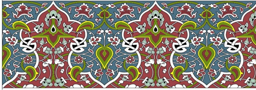
Çizim 3. Mevlana Celaleddin-i Rûmî'nin mermer sandukası üzerinde yer alan 3 no'lu müzeyyen ahşap kapak.