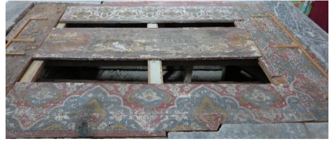
Şekil 2 Mevlana Celâleddin-i Rûmî'nin mermer sandukası ve müzeyyen ahşap kapakları.