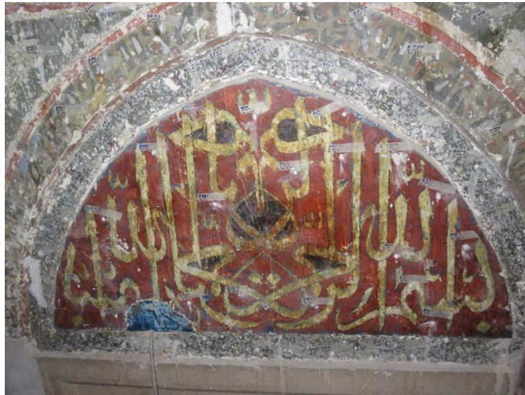
Resim 7. Konya Şerafettin camii kible duvarı pencere alınlığı

Kibâbü'l-aktâb Bölümü batı ve güney alt pencere alınlıklarında yazı ve tezyinat mevcuttur. Batı cephesinde bulunan pencere alınlığında celi sülüs ile yazılmış müsenna tarzında bir besmele bulunmaktadır (Resim 6). Şekil olarak yarım daire tasarlanmış olan besmele alttan başlayarak üst kısma doğru üç satır olarak uygulanmıştır. Yazı müsenna şeklinde olduğundan mütevellit sağdan sola ve soldan sağa olmak üzere aynalı şekildedir. Orta kısma gelen harfler ise, istifi tamamlayıcı mahiyette iç içe geçmiş olarak yazılmıştır. Turuncu zemin üzerine beyaz renkte uygulanan yazıyı kimin yazdığı belli değildir. Bu yazının şekil, renk ve tasarım açısından bir benzeri Konya Şerafettin camii kible duvarında pencere alınlığında yer almaktadır (Resim 7).