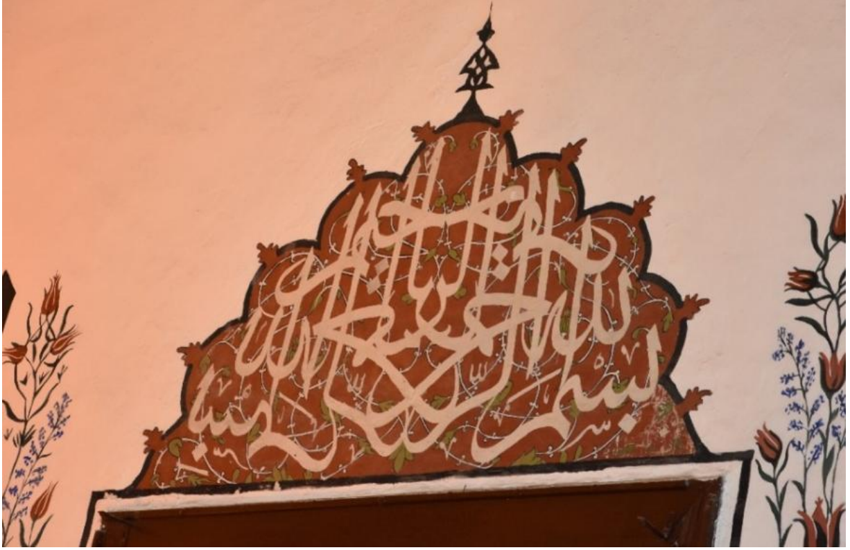
Resim 6. Batı cephesi pencere alınlığı

Kibâbü'l-aktâb Bölümü batı ve güney alt pencere alınlıklarında yazı ve tezyinat mevcuttur. Batı cephesinde bulunan pencere alınlığında celi sülüs ile yazılmış müsenna tarzında bir besmele bulunmaktadır (Resim 6). Şekil olarak yarım daire tasarlanmış olan besmele alttan başlayarak üst kısma doğru üç satır olarak uygulanmıştır. Yazı müsenna şeklinde olduğundan mütevellit sağdan sola ve soldan sağa olmak üzere aynalı şekildedir. Orta kısma gelen harfler ise, istifi tamamlayıcı mahiyette iç içe geçmiş olarak yazılmıştır. Turuncu zemin üzerine beyaz renkte uygulanan yazıyı kimin yazdığı belli değildir. Bu yazının şekil, renk ve tasarım açısından bir benzeri Konya Şerafettin camii kible duvarında pencere alınlığında yer almaktadır (Resim 7).