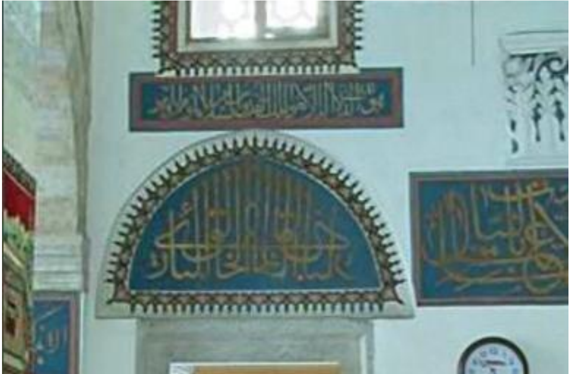
Resim 9. Konya Şerafeddin camii pencere alınlığı.

Kible duvarında bulunan iki pencere alınlığında celi sülüs hattı ile Müsennâ formunda “ El-Hâliku'l-Bâri ”(cc) ( yaratıcı, varlık veren ) esmaları, Kûfî yazı ile “ El Musavvir ”(cc) ( tasvir eden, her şeye şekil ve sûret veren ), esmaları vardır (Resim 8). Aynalı(Müsenna) formunda tasarlanan ve uygulanan yazı soldan sağa ve sağdan sola olmak üzere iki taraflı olarak okunmaktadır. Yarım daire formunda tasarlanan kompozisyon ortadan başlayarak kenarlara doğru okunmaktadır. Kelimenin başında ve ortasında olan dik harfler geometrik formda örgülü kufî yazı çeşidinden ilham alınarak birbiri ile kesiştirilmiştir. Tasarım tek satır halinde yazılmış, dik çıkan elif harfleri ve makus yazılmış “Ya” harfi ile yazı ve istif dengeli bir şekil almıştır. Kufî yazı siyah renkte, sülüs yazı ise siyah renkte uygulanmıştır. Yazıda hattata iat bir ketebe yoktur. Bu yazının çok benzeri Konya Şerafeddin Camii kible duvarında pencere alınlığında bulunmaktadır (Resim 9). Aynı yazı tarzı ve üsluba sahip yazıda Şerafeddin Camii yazısından farklı olarak kufî yazı bulunmamaktadır.