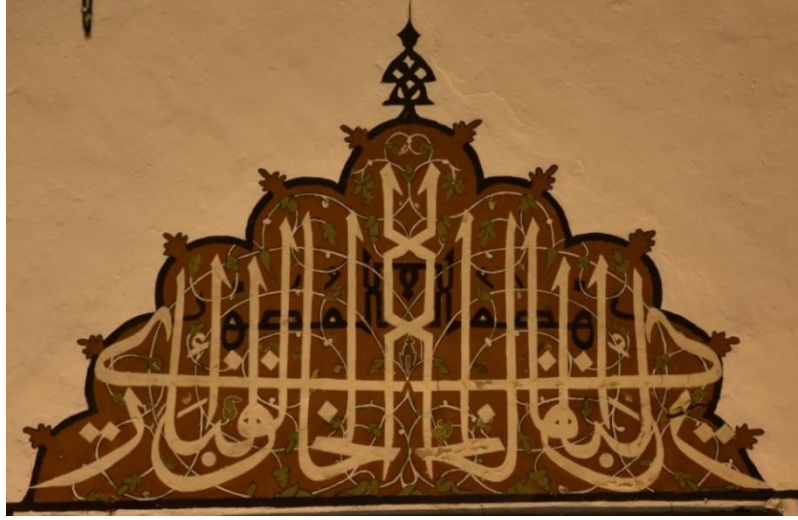
Resim 8. Doğu cephesi pencere alınlığı

Kible duvarında bulunan iki pencere alınlığında celi sülüs hattı ile Müsennâ formunda “ El-Hâliku'l-Bâri ”(cc) ( yaratıcı, varlık veren ) esmaları, Kûfî yazı ile “ El Musavvir ”(cc) ( tasvir eden, her şeye şekil ve sûret veren ), esmaları vardır (Resim 8). Aynalı(Müsenna) formunda tasarlanan ve uygulanan yazı soldan sağa ve sağdan sola olmak üzere iki taraflı olarak okunmaktadır. Yarım daire formunda tasarlanan kompozisyon ortadan başlayarak kenarlara doğru okunmaktadır. Kelimenin başında ve ortasında olan dik harfler geometrik formda örgülü kufî yazı çeşidinden ilham alınarak birbiri ile kesiştirilmiştir. Tasarım tek satır halinde yazılmış, dik çıkan elif harfleri ve makus yazılmış “Ya” harfi ile yazı ve istif dengeli bir şekil almıştır. Kufî yazı siyah renkte, sülüs yazı ise siyah renkte uygulanmıştır. Yazıda hattata iat bir ketebe yoktur. Bu yazının çok benzeri Konya Şerafeddin Camii kible duvarında pencere alınlığında bulunmaktadır (Resim 9). Aynı yazı tarzı ve üsluba sahip yazıda Şerafeddin Camii yazısından farklı olarak kufî yazı bulunmamaktadır.