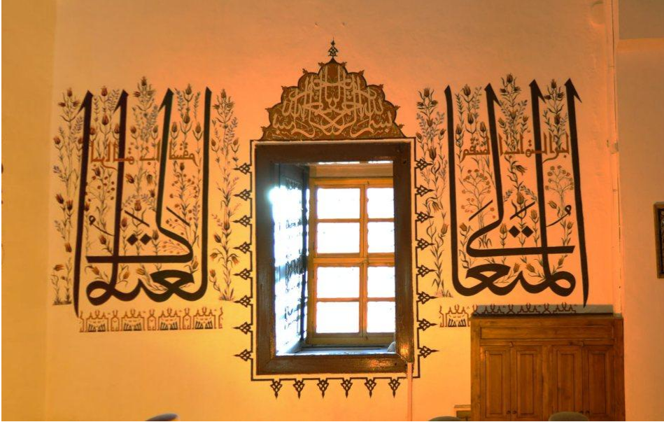
Resim 4. Kibâbü'l-aktâb bölümü batı duvarı.

Kibâbü'l-aktâb bölümünde bulunan iki kubbenin pandantiflerinde sekiz adet daire formunda siyah zemin üzerine yaldızla yazılmış yazılar bulunmaktadır. Osmanlı son dönemine ait olan yazılarda Allah, Muhammed, Ebu Bekir, Ömer, Osman, Ali, Hasan, Hüseyin isimleri bulunmaktadır.