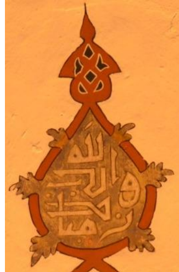
Resim 12. Güney cephesi yazılı tiğ detayı.

Güney duvarında bulunan yatay dikdörtgen formdaki yazı celi sülüs hattı ile yazılmıştır (Resim 10). Yazıda “Allah (cc), Hz. Muhammed (sas), Ebu Bekir (ra), Ömer (ra), Osman (ra), Ali (ra)” isimleri bulunmaktadır. Yazının içerisinde üst kısımda kufi yazı çeşidi ile alttaki isimlere nispeten “azze ve