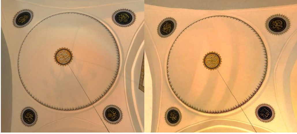
Resim 3. Kibâbü'l-aktâb bölümü kubbeleri

Kubbede etek kısmından göbek kısmına doğru uzanan küçük tığlar bulunmaktadır (Resim 3). Aynı tığlar kubbenin dört tarafında yazılan yazıların çevresine de yapılmıştır. Kubbe göbeğinde de sarı zemin üzerine beyaz Rûmîler ve hatayi grubu motifler ile bezenmiştir. Bezemenin dışında da siyah renkte flato ile yine zemini sarı renkte yapılmış dendanlı küçük tığlar yapılmıştır.