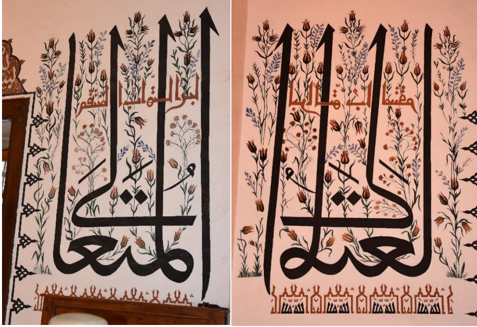
Resim 5. Kıbâbü'l-aktâb bölümü batı duvarı detayı.

Kıbâbü'l-aktâb bölümünde celi sülüs kufi ve makılı yazı çeşitleri bulunmaktadır. Bu yazılar 15. Yüzyıl Bursa üslubu yazı özellikleri ile benzerlik göstermektedir. Yazılar henüz olgunlaşmamış bir celi sülüs tavrı, müsenna yazı kullanımı ve yazı içerisinde bulunan süslemelerle birlikte kufi yazı özellikleriyle öne çıkmaktadır.