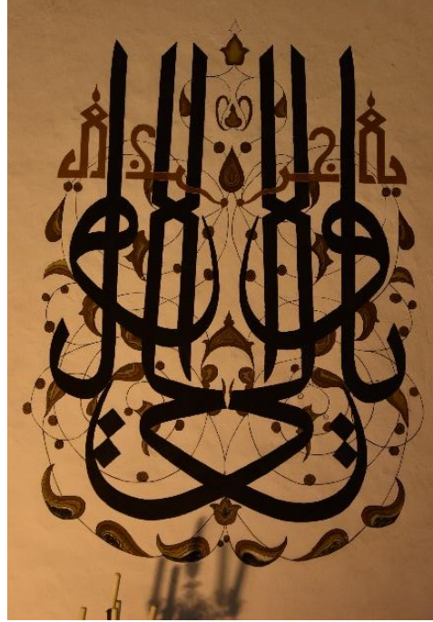
Resim 13. Güney cephesi duvar kalemîşi

Güney cephedeki yazılar siyah zemin üzerine yapılmış ve ara boşlukları turuncu renkte rûmî ile bezenmiştir (Resim 11). Rûmîlerin iç bünyeleri ve dallar açık turuncu renkte olup kenarları beyaz renk ile tahrirlenmiştir. Yazı ve bezeme alanının dış kısmında sırası ile oksit sarı, aşı kırmızı, beyaz, siyah ve aşı kırmızı renkte birbirine bitişik 5 adet flato (iplik) vardır. Panonun üst kısmında ortalanmış yarım daire formunda üç adet geçme motifi tığ şekilde yapılmıştır. Geçmeler turuncu renkte olup, aralarında küçük turuncu tığlar bulunmaktadır. Geçmelerin ortadakinin üzerinde kapalı alan içerisinde yazı, diğer ikisinde de tepelik formunda bezemeler görülmektedir.