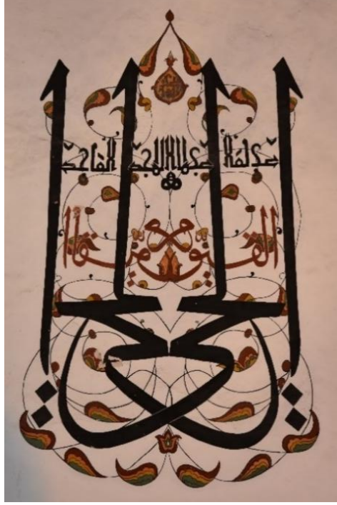
Resim 14. Güney cephesi duvar kalemîşi

Kible duvarında bulunan ikinci pencerenin solunda bulunan yazı yine aynalı (Müsenna) bir formda yazılmıştır (Resim 14). Yazıda celi sülüs hat ile “El-Hayy”(cc)(mutlak hayat sahibi), orta kısımda daha küçük boyutta yine celi sülüs ile daha küçük bir kalemle yazılmış “El-Kayyûm”(cc)(her şey onunla kâim olan) esması bulunmaktadır. Celi sülüs yazı iç içe geçmiş bir formda uygulanırken, kufi hat ile “el mâcid”(cc) (Şanı ulu, yüce, kutlu ve keremi bol, çok cömert) yazısı tasarlanmıştır. Celi sülüs yazılardan büyük olan beyaz zemin üzerine siyah renk ile küçük olan ise bordo renk ile uygulanmıştır. Kufi yazı ise siyah renk mürekkeple tasarlanarak yazılmıştır. Yazı içerisinde bir kebbe yoktur.