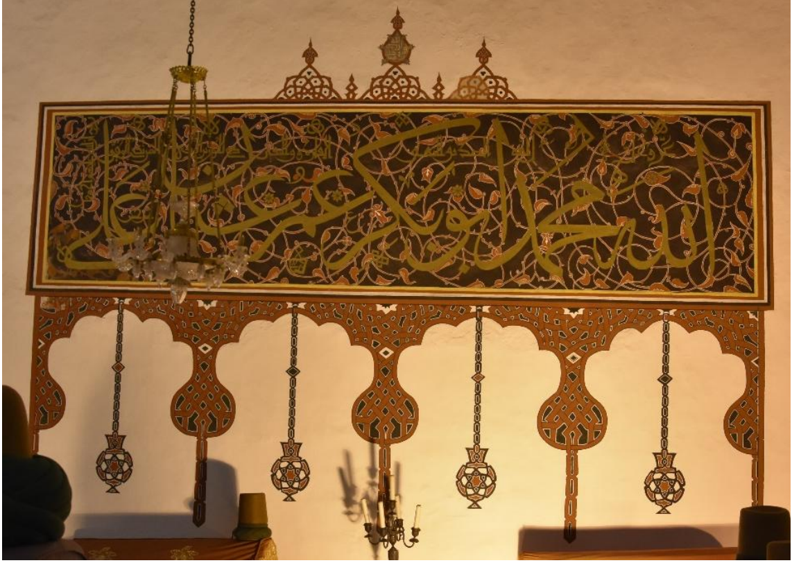
Resim 10. Güney cephesi duvar bezemesi.

Yazıların zemininde hatâi grubu motifler ile oluşturulmuş ½ simetrik desenin zemin rengi ise turuncudur (Resim 8). Hatâi motifleri yeşil renkte, dallarda beyaz zeminli olup siyah renk ile tahrirlenmiştir. Tasarımda uygulanan motiflerin bir kısmının kanaviçelerinde ciddi bozukluk mevcuttur. Ayrıca tasarımı yapılan alanın çevresi siyah renk flato ile kaplıdır. Bezeme alanının çevreleyen dendanların orta kısmında içeriden dışa doğru uzanan yaprak motifleri görülmektedir.