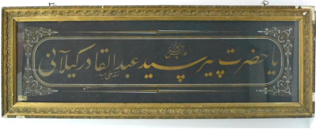
Resim 4: 28727Envanter Numaralı Eser