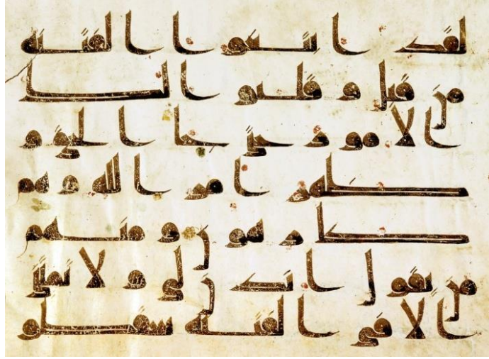
Resim 1: Kûfi Hattıyla yazılmış bir Kur'an-ı Kerim sayfası

"Meşk" ismindeki yazı Aklam-ı Sitte'nin oluşmasında temel teşkil eden yazı çeşidi olmuştur. Bu yazılar yazıldığı şehre nispet edilerek isimler almışlardır. Örneğin Mekke'de yazılan yazılara Mekki, Medinede yazılan yazılara Medeni ismi verilmiştir. Tarihsel gelişim sürecinde resmi işlerde kullanılan "Cezm" ismindeki yazı Hz. Ali (r.a.) tarafından düzenlenerek Kufe'de "Kufi" ismi ile adlandırılmıştır (Alparslan-2016). (Resim 1)