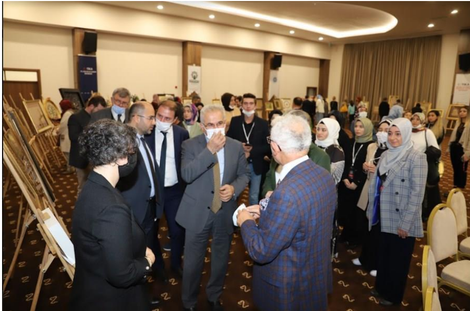
Resim 21. Uluslararası Geleneğimiz Geleceğimiz Ve Ustalarımız Sempozyumu Uluslararası Jüri Karma Sergisi

Sempozyum açılış töreni ve Fahri Doktora takdim töreninin ardından 34 değerli akademisyen ve araştırmacının katılımıyla sekiz oturum ile başarılı bir şekilde tamamlanmıştır. "Uluslararası Geleneğimiz, Geleceğimiz ve Ustalarımız" konulu Sempozyum, Sergi ve Çalıştay olmak üzere üç farklı alanda icra edilmiştir. Sempozyumun ana teması Geleneğimiz, Geleceğimiz ve Ustalarımız olup, alt başlıkları; Geleneksel Sanatların Dünü Bugünü, Geleneksel Sanatların Günümüzdeki Sorunları, Geleneksel Sanatlarda Terminoloji, Geleneksel Sanatlar ve Zanaatlar, Geleneksel Sanatların Ustaları, Geleneksel Sanatlar Eğitimi, Geleneksel Mimari, Hat Sanatı, Tezhip Sanatı, Minyatür Sanatı, Kalemîşi Sanatı, Çini Sanatı, Ebru Sanatı gibi alanlar oluşturmuştur.