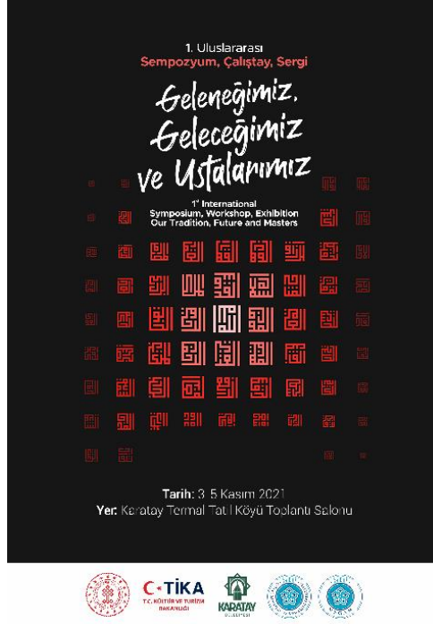
Resim 1 1. Uluslararası Geleneğimiz Geleceğimiz Ve Ustalarımız Sempozyumu Afişi

Necmettin Erbakan Üniversitesi (NEÜ) Güzel Sanatlar Fakültesi Geleneksel Türk Sanatları Bölümü tarafından düzenlenen 1. Uluslararası Geleneğimiz Geleceğimiz Ve Ustalarımız Sempozyumu 02 Kasım 2021 günü Fahri Doktora Takdim Töreni ile başlamıştır. 03-05 Kasım 2021 tarihleri arasında Sempozyum, Çalıştay ve Sergi olmak üzere, Konya Karatay Termal Köyü'nde yapılmıştır.