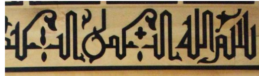
Resim 10 Ahşap Mihrap Üçüncü Bordür Detayı

Dördüncü bordür iç kısma doğru girmektedir. Diğer bordürlerde olduğu gibi rumi olarak yapılmıştır. İki iplik rumilerin bulunduğu bu bordürde ikinci bir renk kullanılmıştır. Mozaik çini mihrapta kiremit renginde olan sencide rumiler vardır(Fotoğraf 11). Ahşap mihrapta da aynı tasarım kullanılarak kiremit rengi kullanılmıştır(Fotoğraf 12). Bu bordürde de rumi formları mozaik çini mihrapta oldukça ince işçilik ile yapılmışken ahşap mihrapta rumi formları kalın ve kısa bitecek şekilde yapılmıştır.