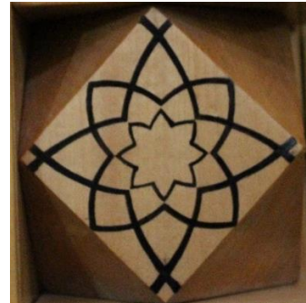
Resim 21 Ahşap Mihrap Sütunçe Başlık Detayı

Sütunçelerin gövdelerinde ise birbirini takip eden dendanlar kullanılmıştır. Mozaik çini mihrapta sadece patlıcan moru rengi ile devam eden dendanların zemini turkuaz renktedir(Fotoğraf 22). Ahşap mihrapta ise siyah renk tercih edilmiştir ve zemininde de ahşap gözükmektedir(Fotoğraf 23).