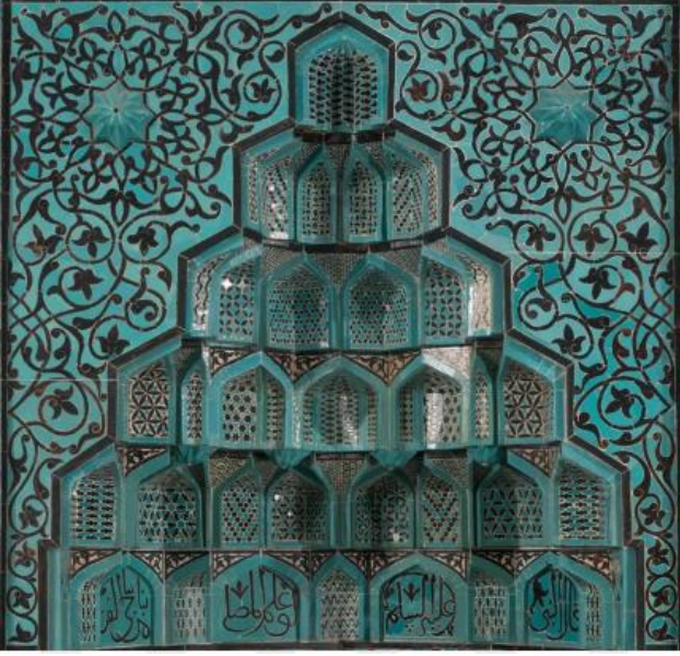
Resim 15 Çini Mihrap Köşelik ve Mukarnas Detayı

işlenmiştir. Ahşap mihrabın mukarnası ise boştur. Mihraplara bakıldığında net farkın mukarnalarda olduğu görülmektedir. Mozaik çini mihrapta yer alan mukarnas detaylarının ve motiflerinin hiçbirisi ahşapta kullanılmamıştır.