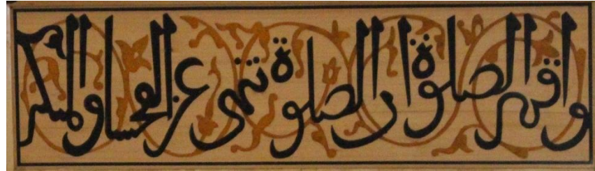
Resim 14 Ahşap Mihrap Alınlık Detayı

Alınlık kısmından sonra mihrabın köşelik ve mukarnas detaylarına geçilmektedir. Köşelikler simetrik olarak tasarlanmıştır ve rumi motifleri kullanılmıştır. Mozaik çini mihrapta rumiler patlıcan moru kullanılarak bezenmiştir ve rumi zeminleri firuze renginde kullanılmıştır(Fotoğraf 15). Ahşap mihrapta renkler siyah olarak yapılmıştır ve zemin ahşap görüntüsündedir(Fotoğraf 16). Köşeliklerde rumilerde bulunan form bozukluklarının haricinde bir farklılık daha bellidir. Mihrapta simetri birleşim yerlerinde sekizgen bir tasarım yer almaktadır. Bu tasarımda mozaik çini mihrapta zemin rengini tamamlayacak şekilde kabalar kullanılmıştır. Ancak ahşap mihrapta bu karalar sadece sınırları belli edilecek şekilde yapılarak düz bırakılmıştır ve kabara yapılmamıştır. Mozaik çini mihrapta kabara kısmına geçişte de rumiler yer almaktadır. Ahşap mihraba bakıldığında ise neredeyse çizgi denilecek kadar ince bir çizim yapılmış ve rumi olması gereken yerler nokta olarak eklenmiştir.