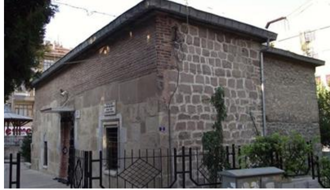
Resim 1 Beyhekim Mescidi ve Türbesi Kuzey ve Doğu Cephesi Genel Görüntümü

cemaat bölümünden oluşmaktadır(Yaldız, 2018). Halen mescit olarak kullanılmakta olan yapının iç kısmında üç bölüm vardır. Girişinin sağ tarafında türbe bölümü, sol tarafında kadınlar mahfili bulunur. Harim kısmı ise bu bölümleri geçtikten sonra gelmektedir. Kadınlar mahfili olarak adlandırılan bölüm daha öncesinde türbedar odası olarak kullanılmaktaydı(Turan, 2018, s. 131).