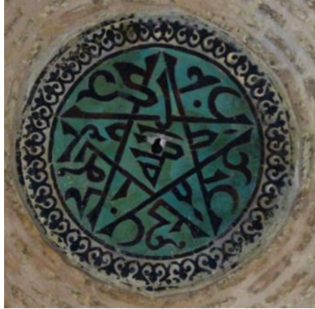
Resim 24 Beyhekim Mescidi ve Türbesine Ait Kubbe Göbeği

Mihrap süslemesinin haricinde kubbe göbeğinde de yuvarlık bir mozaik çini tasarımı yer almaktadır(Fotoğraf 24). Kubbe göbeği mihrapta olduğu gibi mozaik çini tekniğinde yapılmıştır. Patlıcan moru ve turkuaz renkleri kullanılarak yapılan göbekte beş kollu bir yıldız yer almaktadır. Beş kollu yıldızın orta kısmında “Allah” yazmaktadır. Yıldızın kollarında ise “Muhammed, Ebubekir, Ömer, Osman ve Ali” yazmaktadır. Yazılan yazı çeşidi ise çiçekli kufi olarak bilinmektedir(Baş, 2008, s. 21).