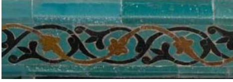
Resim 11 Çini Mihrap Dördüncü Bordür Detayı