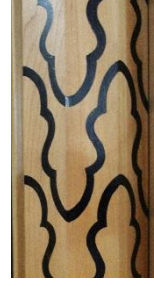
Resim 23 Ahşap Mihrap Sütunçe Gövde Detayı

Mihrap süslemesinin haricinde kubbe göbeğinde de yuvarlık bir mozaik çini tasarımı yer almaktadır(Fotoğraf 24). Kubbe göbeği mihrapta olduğu gibi mozaik çini tekniğinde yapılmıştır. Patlıcan moru ve turkuaz renkleri kullanılarak yapılan göbekte beş kollu bir yıldız yer almaktadır. Beş kollu yıldızın orta kısmında “Allah” yazmaktadır. Yıldızın kollarında ise “Muhammed, Ebubekir, Ömer, Osman ve Ali” yazmaktadır. Yazılan yazı çeşidi ise çiçekli kufi olarak bilinmektedir(Baş, 2008, s. 21).