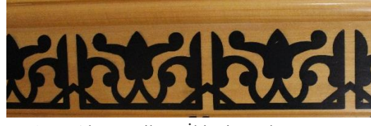
Resim 8 Ahşap Mihrap İkinci Bordür Detayı

Üçüncü bordür yazı kuşağının yer aldığı bordürdür. Yazı kuşağında Ayet-el Kürsi vardır. Makili yazı çeşidi ile yazılan bu yazı çeşidinde renkler mozaik çini mihrapta patlıcan moru rengindedir(Fotoğraf 9). Ahşap mihrapta ise siyahtır(Fotoğraf 10). İki tasarımda da yazı kuşağında boşluk kısımlarında aynı renk tepelikler kullanılarak boş alanlar doldurulmuştur. İki mihrapta da dördüncü bordüre bağlanan kısımda aynı renk kullanılarak yapılan şerit çizgisi vardır.