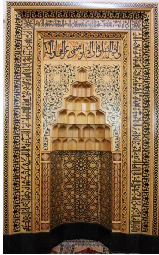
Resim 4 Beyhekim Mescidi ve Türbesi Ahşap Mihrap