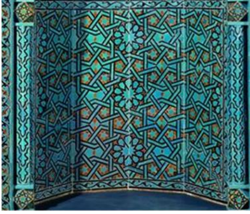
Resim 17 Çini Mihrap Nişi