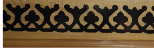
Resim 6 Ahşap Mihrap Birinci Bordür Detayı

İkinci bordür kısmında da rumi motifi kullanılmıştır. İki iplik tepeliklerden oluşan bordür, ilk bordüre göre daha büyük bir alana yapılmıştır ve daha detaylıdır. Rumi renkleri ilk bordürde olduğu gibi patlıcan moru olarak kullanılmıştır(Fotoğraf 7). Ahşap mihrap tamamen yapıldığı için siyah renk kullanılarak yapılmıştır(Fotoğraf 8). Mozaik çini mihrapta birinci ve ikinci bordür kısmı rumi renklerinde kullanılan patlıcan moru rengi ile kalın bir şerit çekilerek ayrılmıştır. Ahşap mihrapta tepeliklerin form bozuklukları dikkat çekmektedir.