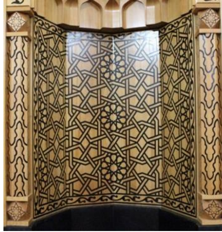
Resim 19 Ahşap Mihrap Niş Detayı

bir tasarım görülmektedir. Sütunçelerin alt ve üst kısımlarında kare prizma formlar kullanılmıştır. Bu sütunçe başlıklarında sekiz kollu yıldızlar vardır. Mozaik çini mihrapta başlığın yan yüzeylerinde altı kollu yıldız kullanılmıştır(Fotoğraf 20). Kiremit, patlıcan moru ve turkuaz renklerine yer verilmiştir. Ahşap mihrapta ise tek renk siyah kullanılmıştır ve yan yüzeylerde herhangi bir tasarıma yer verilmemiştir(Fotoğraf 21).