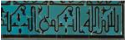
Resim 9 Çini Mihrap Üçüncü Bordür Detayı

Yazı kuşağı alanında yer alan Ayet'el Kürsi'nin boşluk kısımlarında tepelik vardır. Tepelik motiflerinin ahşap mihrapta form bozuklukları gözle görülür derecede bellidir. Yazı kuşağının olduğu üçüncü bordürde köşe kısımlarında kalan boşluklarda sekiz köşeli geometrik desen kullanılmıştır. Ahşap mihrap ve mozaik mihrapta mihraba uygun olarak aynı renkler kullanılmıştır.