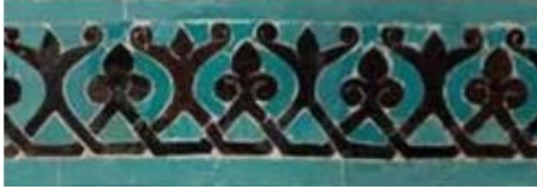
Resim 5 Çini Mihrap Birinci Bordür Detayı

göstermiştir. Mozaik çini mihrapta rumi dalları bir alt bir üst şeklinde ilerlemiş ve bu sayede boyutlu bir görüntü oluşmuştur. Ancak ahşap mihrap düz siyah renkte ve kalınlık inceliğe dikkat edilmeyerek yapılmıştır.