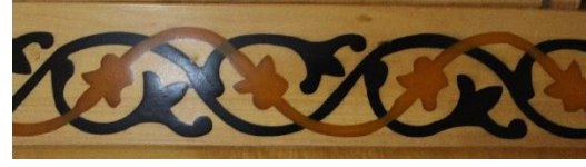
Resim 12 Ahşap Mihrap Dördüncü Bordür Detayı

Bu bordürlerden sonra mihrabın alınlık olarak adlandırılan kısmı gelmektedir. Bu kısımda Selçuklu Sülüsü ile yazılmış Ankebut Suresinin 45. Ayeti vardır. Alınlıkta Ankebut suresinin altında rumi helezonları kullanılmıştır. Rumiler yazıdaki yerleşime göre yapılmıştır. Mozaik çini olarak yapılan mihrapta rumiler kiremit renginde yapılmıştır. Yazılar ise patlıcan moru kullanılarak yapılmıştır. Mozaik çini mihrapta yazı formları da rumi formları da olması gerektiği gibi ince işçilik ile yapılmıştır(Fotoğraf 13). Ahşap mihrapta ise gerek rumi formları gerekse yazı formları gözle görülür derecede bozuktur(Fotoğraf 14). Formlarının aynı yapılmasına dikkat edilmesine rağmen vav, sad gibi harflerde bu fark direkt olarak bellidir. Ahşap mihrapta harflerde yer alan form bozukluklarından kaynaklı bazı harfler birbirine değmektedir. Tek bir harfe bakarak bile bu bozukluğu görmek mümkündür.