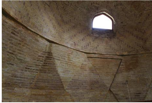
Resim 2 Beyhekim Mescidi ve Türbesi Kubbeye Geçiş Elemanı

Mescit dikdörtgen plana sahip olmasından kaynaklı tek kubbe ile örtülüdür. Üçgen olarak birleşen kubbeye geçiş elemanı baklava biçimindedir ve malzeme olarak tuğla kullanılmıştır(Fotoğraf 2). Günümüzde üzeri metal kaplama olarak kapatılmıştır. Selçuklu döneminde yapılmış mescitlerin genel özelliklerine bakıldığında dikkat çeken özelliklerden birisi kubbelerin tek kubbeli olmasıdır. Ayrıca çoğunun önünde düz çatı veya tonoz vardır(Boran vd., t.y., s. 40).