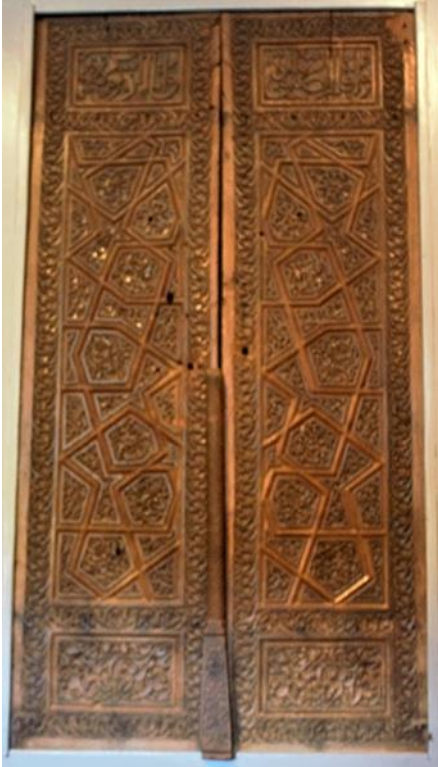
Resim 25 Beyhekim Mescidi ve Türbesine Ait Kapı Kanatları