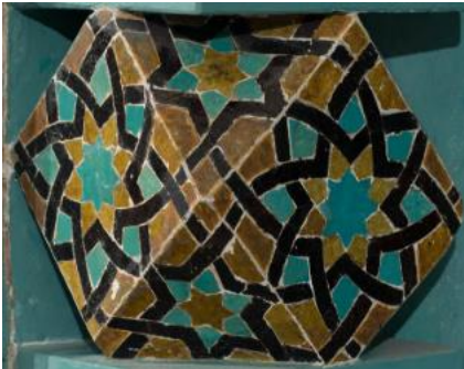
Resim 20 Çini Mihrap Sütunçe Başlık Detayı

bir tasarım görülmektedir. Sütunçelerin alt ve üst kısımlarında kare prizma formlar kullanılmıştır. Bu sütunçe başlıklarında sekiz kollu yıldızlar vardır. Mozaik çini mihrapta başlığın yan yüzeylerinde altı kollu yıldız kullanılmıştır(Fotoğraf 20). Kiremit, patlıcan moru ve turkuaz renklerine yer verilmiştir. Ahşap mihrapta ise tek renk siyah kullanılmıştır ve yan yüzeylerde herhangi bir tasarıma yer verilmemiştir(Fotoğraf 21).