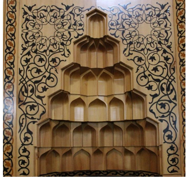
Resim 16 Ahşap Mihrap Köşelik ve Mukarnas Detayı

Mihrap nişinde mukarnasların alt kısımlarında geometrik bir tasarım kullanılmıştır. Mozaik çini mihrapta patlıcan moru renginin yanında kiremit rengine de yer verilmiştir(Fotoğraf 17). Geometrik geçmelerin bazı birleşim yerleri kiremit rengi ile doldurulmuştur. Bazı alanlarda ise geometrilerin iç kısımlarında beş kollu yıldız kullanılmıştır. İki mihrapta da geometrik geçmelerin dört köşesini çevreleyen tek sap olarak yapılmış rumi motifi kullanılmıştır(Fotoğraf 18). Bu rumiler ince küçük bir alana yapılmıştır. Ahşap mihrabın nişi ise tek renkte kullanılmıştır ve siyah renktedir(Fotoğraf 19). Çini mihrapta olduğu gibi kiremit rengi kullanılmamıştır ve geometrilerin iç kısımları boş bırakılmıştır.