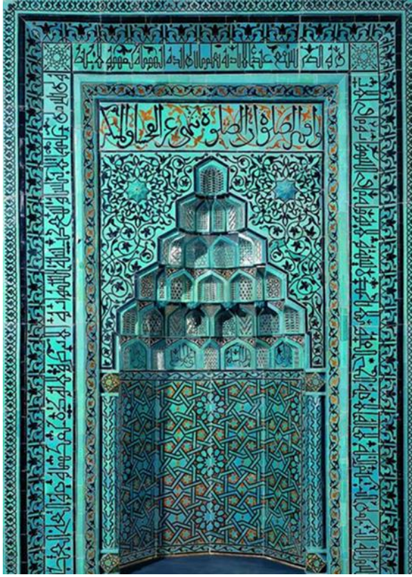
Resim 3 Beyhekim Mescidi ve Türbesi Mozaik Çini Mihrap