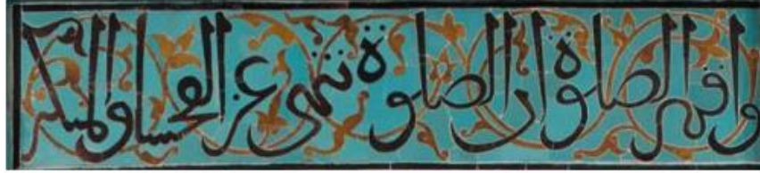
Resim 13 Çini Mihrap Alınlık Detayı

Bu bordürlerden sonra mihrabın alınlık olarak adlandırılan kısmı gelmektedir. Bu kısımda Selçuklu Sülüsü ile yazılmış Ankebut Suresinin 45. Ayeti vardır. Alınlıkta Ankebut suresinin altında rumi helezonları kullanılmıştır. Rumiler yazıdaki yerleşime göre yapılmıştır. Mozaik çini olarak yapılan mihrapta rumiler kiremit renginde yapılmıştır. Yazılar ise patlıcan moru kullanılarak yapılmıştır. Mozaik çini mihrapta yazı formları da rumi formları da olması gerektiği gibi ince işçilik ile yapılmıştır(Fotoğraf 13). Ahşap mihrapta ise gerek rumi formları gerekse yazı formları gözle görülür derecede bozuktur(Fotoğraf 14). Formlarının aynı yapılmasına dikkat edilmesine rağmen vav, sad gibi harflerde bu fark direkt olarak bellidir. Ahşap mihrapta harflerde yer alan form bozukluklarından kaynaklı bazı harfler birbirine değmektedir. Tek bir harfe bakarak bile bu bozukluğu görmek mümkündür.