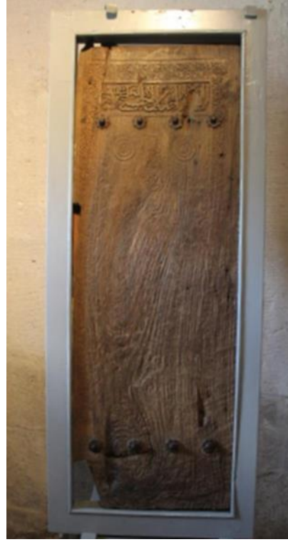
Resim 26 Beyhekim Mescidi ve Türbesine Ait Pencere Kanatları