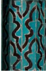
Resim 22 Çini Mihrap Sütunçe Gövde Detayı