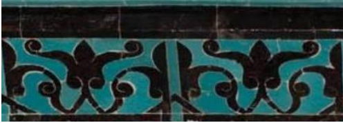
Resim 7 Çini Mihrap İkinci Bordür Detayı

İkinci bordür kısmında da rumi motifi kullanılmıştır. İki iplik tepeliklerden oluşan bordür, ilk bordüre göre daha büyük bir alana yapılmıştır ve daha detaylıdır. Rumi renkleri ilk bordürde olduğu gibi patlıcan moru olarak kullanılmıştır(Fotoğraf 7). Ahşap mihrap tamamen yapıldığı için siyah renk kullanılarak yapılmıştır(Fotoğraf 8). Mozaik çini mihrapta birinci ve ikinci bordür kısmı rumi renklerinde kullanılan patlıcan moru rengi ile kalın bir şerit çekilerek ayrılmıştır. Ahşap mihrapta tepeliklerin form bozuklukları dikkat çekmektedir.