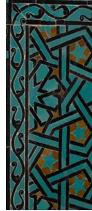
Resim 18 Çini Mihrap Niş Köşesi Detayı